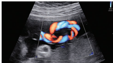
Cordón umbilical con S-Flow™

S-Flow™, una tecnología de imagen direccional Power Doppler, puede ayudar a detectar incluso los vasos sanguíneos periféricos. Permite un diagnóstico preciso cuando el examen del flujo sanguíneo es especialmente difícil.