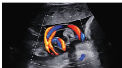
S-Flow™ con LumiFlow™ (Cordón de color)

LumiFlow™ es una visualización tridimensional del flujo sanguíneo, que ayuda a comprender la estructura del flujo sanguíneo y los vasos pequeños de forma intuitiva.