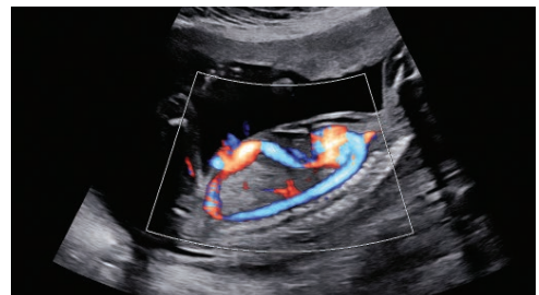
Circulación fetal con S-Flow™