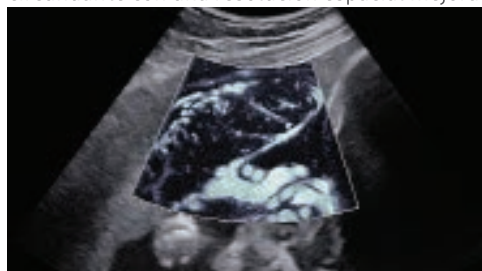
Placenta with MV-Flow™

MV-Flow™ ofrece una alternativa novedosa al Doppler de potencia para visualizar el flujo lento de estructuras microvascularizadas. Las altas velocidades de cuadro y el filtrado avanzado permiten que MV-Flow™ proporcione una vista detallada del flujo sanguíneo en relación con el tejido o la patología circundante con una resolución espacial mejorada.